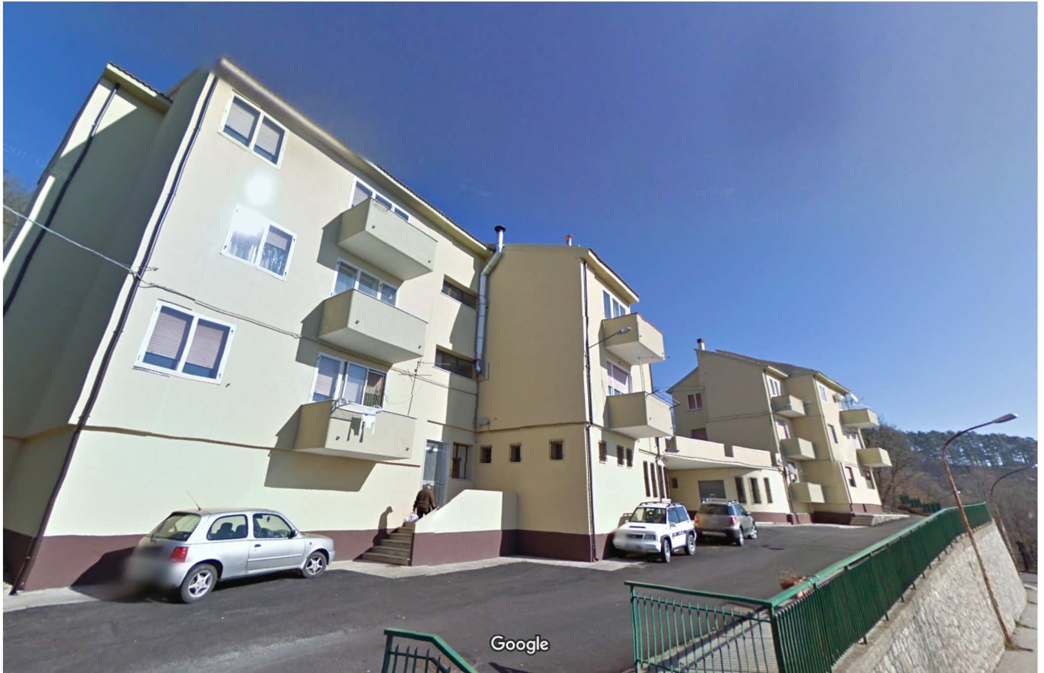
Data dell'immagine: feb 2011